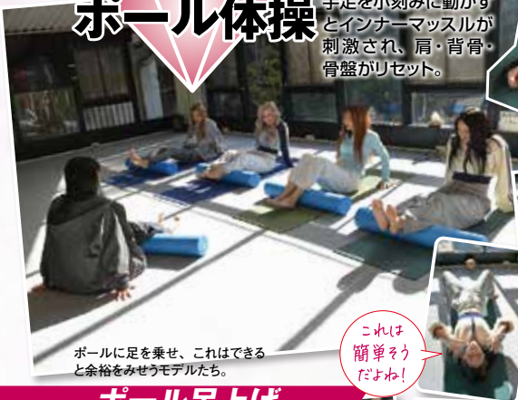
ポールに足を乗せ、これはできると余裕をみせろモデルたち。