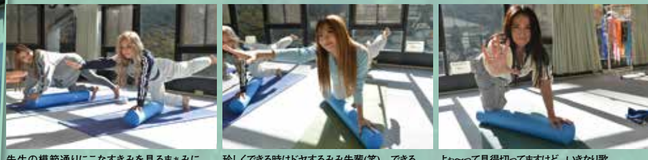
先生の模範通りにこなすきみを見るまみに注目! そんな刺すような目で見なくても!