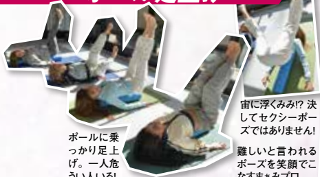
ポールに乗っかり足上げ。一人危うい人いる!

宙に浮くみみ!? 決してセクシーポーズではありません! 難しいと言われるポーズを笑顔でこなすまみアプロ。